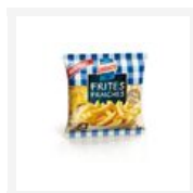
Lustucru Frites fraîches